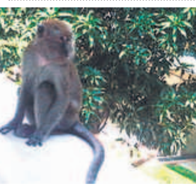
▲野猴在武吉班让一处多层停车场出没，还企图攻击居民。