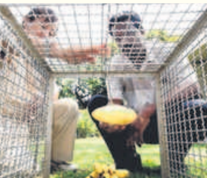
▲遭遇猴患的公众可向农粮局租用捕捉器，设阱捕捉。

农粮局也提醒公众不要喂养野猴，因为这会改变它们的生活习性，为获取美食，从森林走进人类居住区，造成干扰。