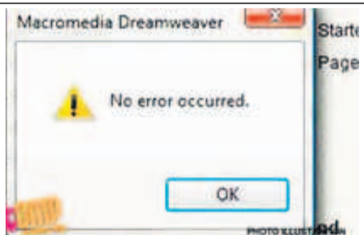
▲软件不能使用，竟说是因为“没有错误出现”。