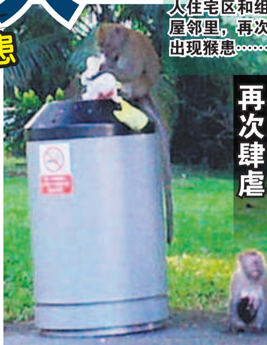
▲两只野猴在乌鲁班丹巴士站的垃圾桶觅食，一只打开食物，另一只“把风”。

此外，武吉班让组屋区上星期也开始出现猴踪，有人在凌晨时分发现野猴在巴士站和多层停车场出没，一有人接近就目